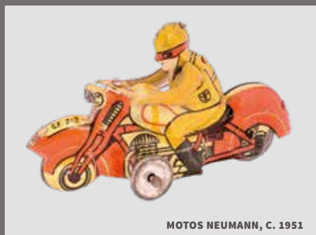
MOTOS NEUMANN, C. 1951

SON EN SU MAYORÍA JUGUETES QUE NOS MUESTRAN COMO ERA LA VIDA COTIDIANA DE ESA PARTE DEL SIGLO XX A TRAVÉS DE LA MINIATURIZACIÓN DE LA VIDA REAL COMO LO MUESTRAN COCINITAS, MICROBUSES, CARRETAS PANADERAS, ETC