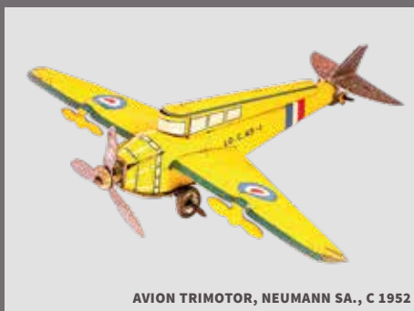
AVION TRIMOTOR, NEUMANN SA., C 1952

NO OBSTANTE, ALGUNAS Y QUIZÁS LA MAYORÍA DE ELLAS DE ALGÚN MODO LLEVAN ALGUNA INSCRIPCIÓN O IMAGEN QUE LA VUELVEN VERNÁCULA, ES DECIR LE DA IDENTIDAD NACIONAL COMO SON LOS NOMBRES O LUGARES COMUNES DE NUESTRO PAÍS. LO QUE DISTINGUE A ESTA EXPOSICIÓN DE OTRAS DE JUGUETES UNIVERSALES.