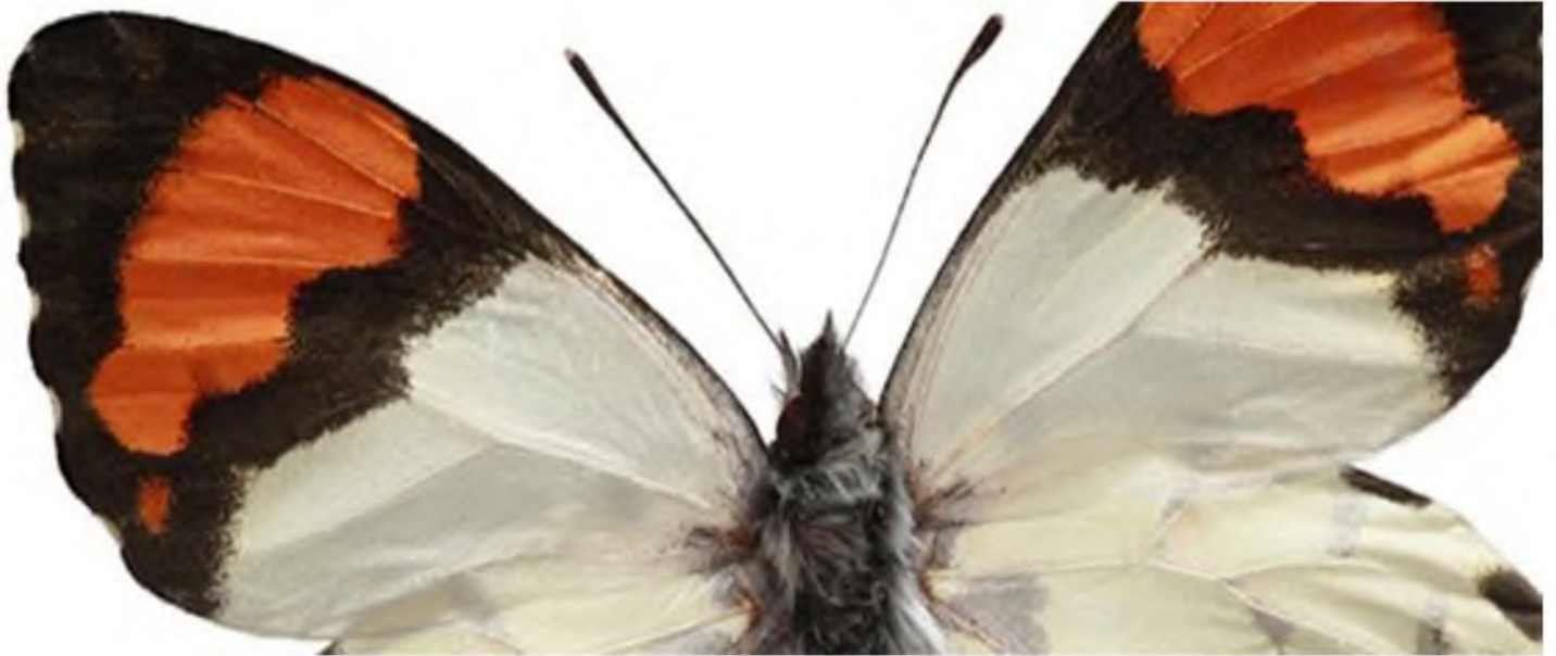
Mariposas de Chile