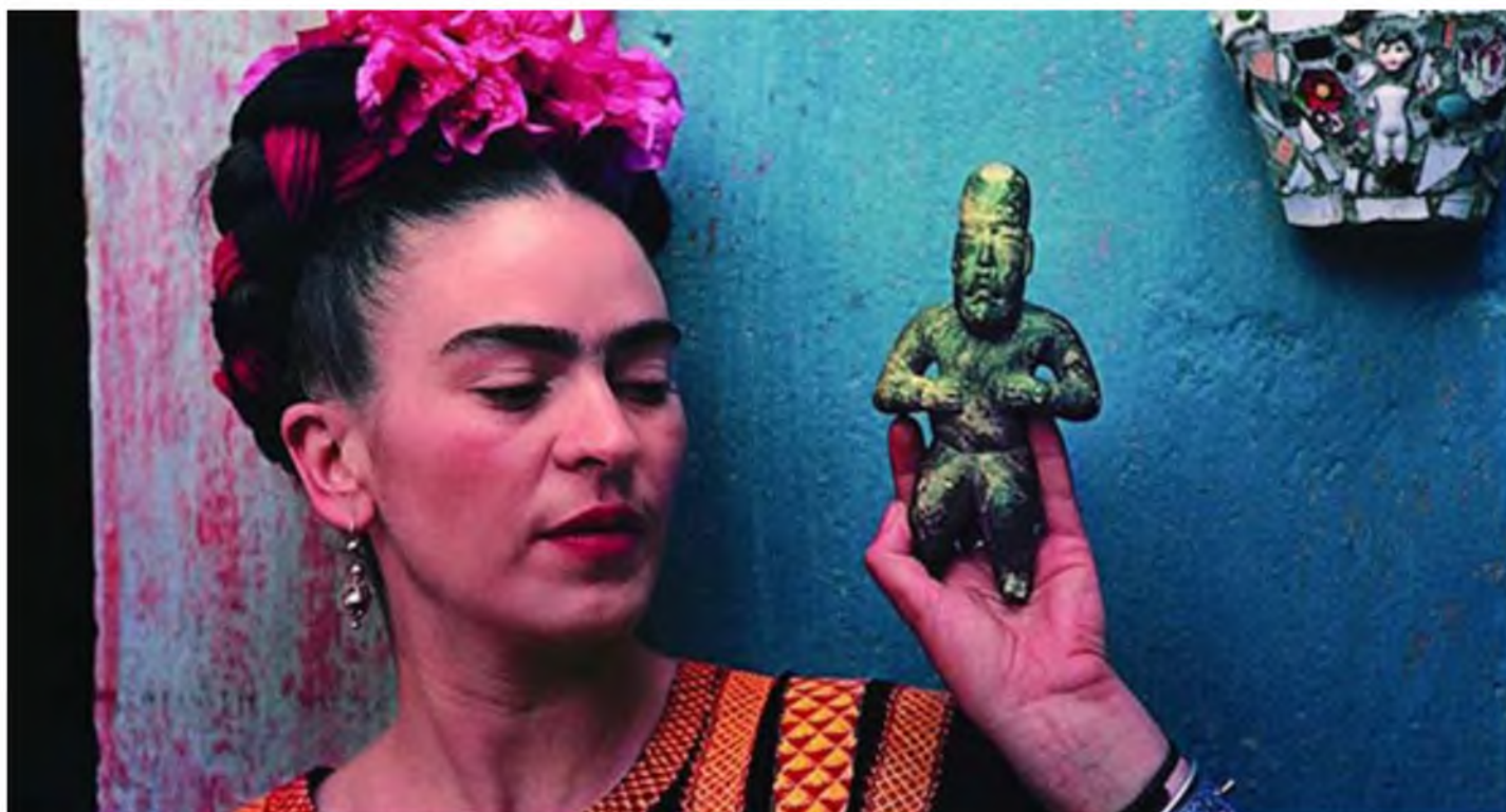
Mujeres en el Arte