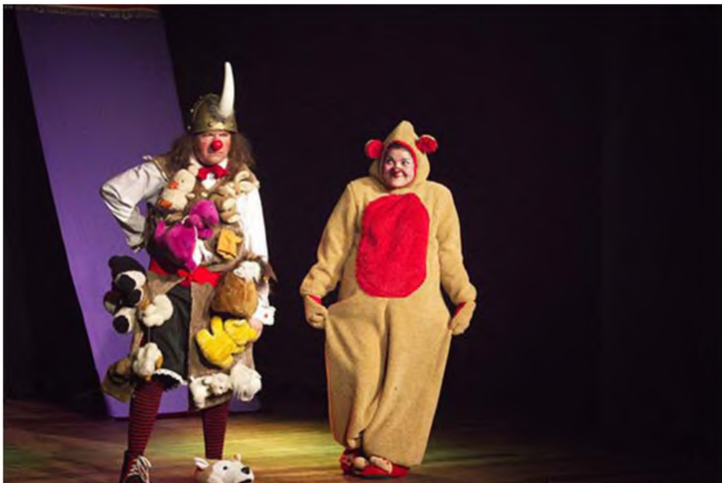
Ayayai, de la Compañía El festín de la Risa